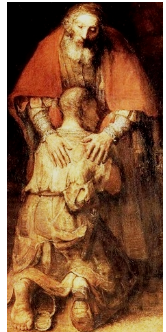
Dettaglio del Ritorno del Figliol Prodigio, Rembrandt, 1666, San Pietroburgo.